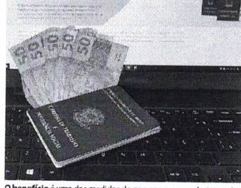
O benefício é uma das medidas do governo para combater a crise na economia decorrente da pandemia.

remunerações corretas, assumindo o salário mínimo como base, para que o trabalhador não deixasse de receber o BEm”, diz a nota. Com isso, segundo a secretaria, cerca 2,7% do total das parcelas pagas na semana passada (23,6 a 26,6) e das parcelas agendadas para pagamento nesta semana (30,6 a 30,7), tiveram o valor reduzido para 97 mil trabalhadores.